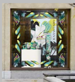
Vitrine Karaverso 08

A l'issue de l'année 2008, plus de 300 vitrines ont été mise en place sur l'ensemble de l'hexagone et 100 % de la clientèle a été satisfaite des retombées commerciales de cette opération.