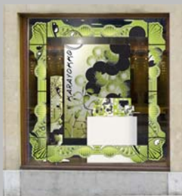
Vitrine Karayokko 08

En 2008, Kara a lancé « l'opération vitrines ». Le but de cette opération était de créer une animation du point de vente par un décor de vitrine attractif, mettant en avant les collections Karayokko et Karaverso .