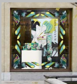
Vitrine Karaverso 08

A l'issue de l'année 2008, plus de 300 vitrines ont été mise en place sur l'ensemble de l'hexagone et 100 % de la clientèle a été satisfaite des retombées commerciales de cette opération.