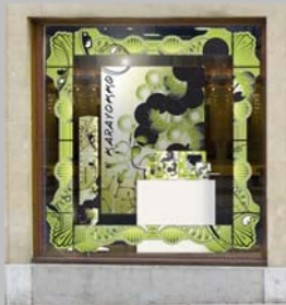
Vitrine Karayokko 08

En 2008, Kara a lancé « l'opération vitrines ». Le but de cette opération était de créer une animation du point de vente par un décor de vitrine attractif, mettant en avant les collections Karayokko et Karaverso .